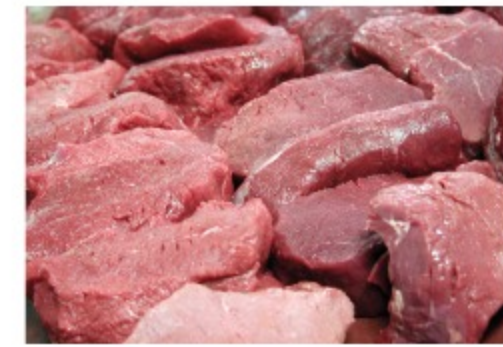
Carne sintetica: per Slow Food non è soluzione ad una domanda...