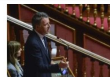
Renzi "Sulla giustizia serve una riforma vera"