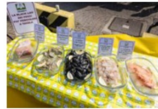
Pesce straniero: dalle importazioni in Italia scatta un allarme sanitario alla...