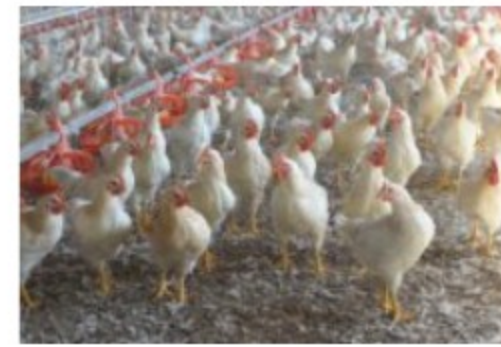
Settore avicolo in difficoltà: produzione a -11,2% nel 2022