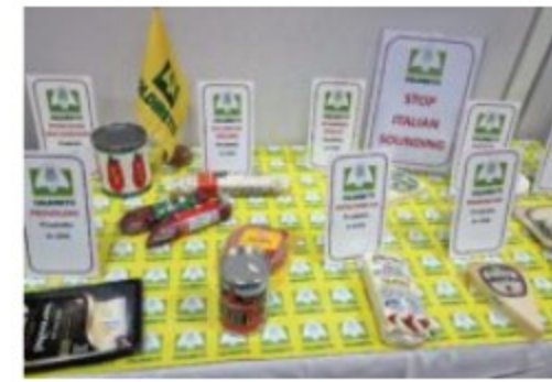
Al "Fancy Food" 2023 di New York l'agroalimentare italiano in forze