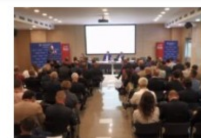
Cybersecurity, 14 Pmi venete su 100 hanno subito attacchi hacker